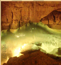
Grotte de Label