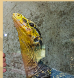
Le reptilium du Larzac