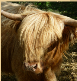
Le parc du Theil

Les sites Templiers et Hospitaliers du Larzac