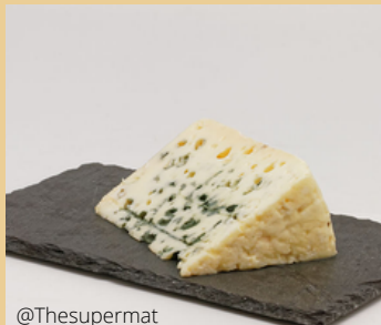
Caves de Roquefort