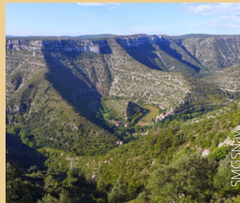
Cirque de Navacelles