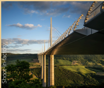
Viaduc de Millau